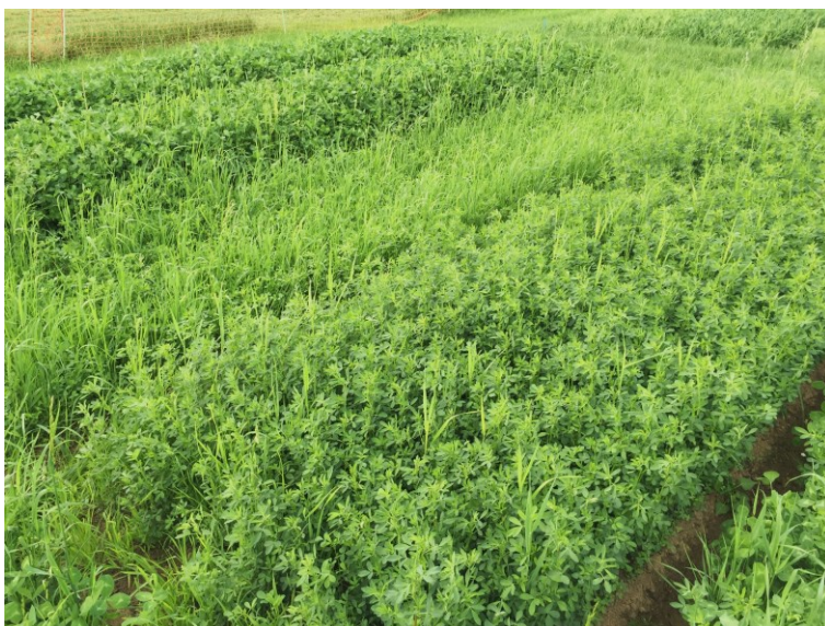
Abbildung 1: Klee- und Luzernegras-Mischungen mit verschiedenen hohen Anteilen an Leguminosen.