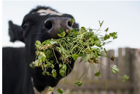
Weiß- und Rotklee bieten Milchkühen ein schmackhaftes Grundfutter.

Die erstmalige Nachsaat erfolgte im Frühjahr 2023 auf Betrieben verteilt in ganz Oberschwaben. Die Sortenwahl, Mischung und Ausbringungspraxis wurden unter fachlicher Begleitung abgestimmt und orientieren sich an den Praxis-Empfehlungen zur Leguminosen-Nachsaat, die vom LAZBW im Rahmen der Eiweißinitiative Baden-Württemberg erarbeitet wurden. Geplant ist den Erfolg der Grünlandaufwertung, gemessen an der Anzahl der Schnitte und dem Ertrag, aufzuzeigen. Im Handel wird die Milch, die von den aufgewerteten Grünlandflächen stammt, nicht speziell ausgelobt, da keine getrennte Erfassung erfolgt.